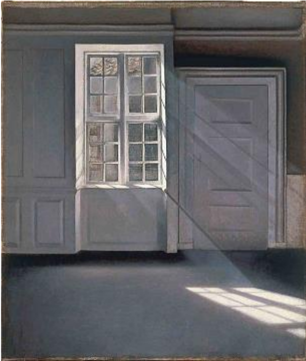
Vilhelm Hammershøi, Sonnenstrahlen oder Sonnenlicht